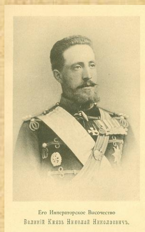
Его Императорское Высочество Великий Князь Николай Николаевич.